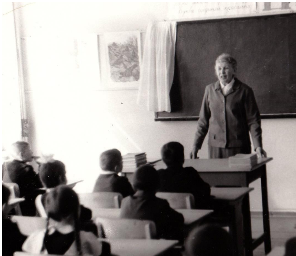
1974 год. На уроке